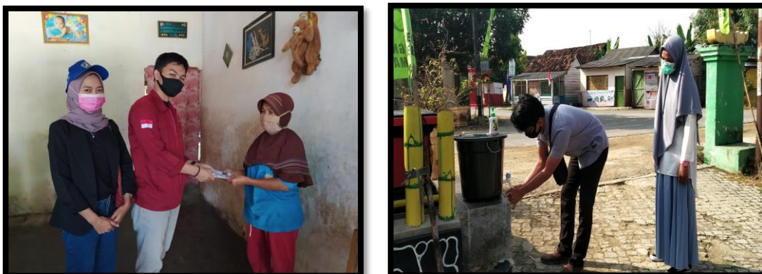
Gambar 3. Foto Saat Cuci Tangan Sebelum Melakukan Kegiatan/ Masuk Kepekon Podomoro

Pada pelaksanaan, kegiatan ini dilakukan secara door to door atau dari pintu ke pintu dengan bertatap muka secara langsung/pribadi dikarenakan situasi yang belum memungkinkan untuk melakukan sosialisasi pengabdian kepada masyarakat yang bersifat berkumpul massal dalam suatu lingkup ruangan. Sosialisasi ini pun menggunakan metode ceramah dengan menjelaskan melalui brosur yang telah diberikan kepada masyarakat dan menggunakan metode praktik secara langsung tentang perilaku hidup bersih dan sehat seperti contoh mencuci tangan. Target masyarakat penerima masker adalah 150 orang dengan 16 orang perwakilan yang tercantum dalam tanda bukti secara tertulis.