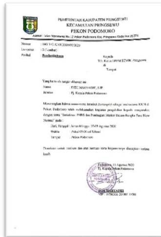
Gambar 2. Surat Permohonan Kepala Desa/Pekon Podomoro