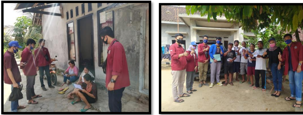
Gambar 4. Saat Pemberian Materi Tentang PHBS, New Normal dan Pembagian Masker Kepada Masyarakat Lingkungan Dusun 2 Podomoro

disimpulkan bahwa tujuan kegiatan ini dapat tercapai.