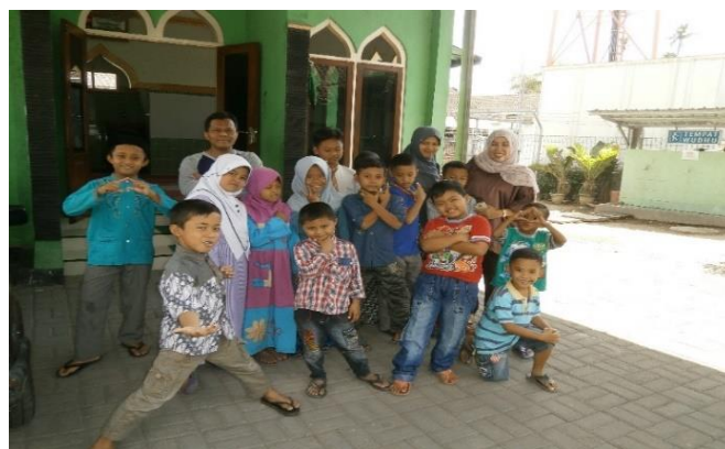
Gambar 6. Santriwan dan santriwati