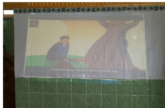
Gambar 3. Pemutaran video dongeng