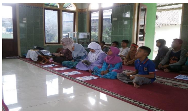
Gambar 4. Sesi Diskusi dan Tanya Jawab