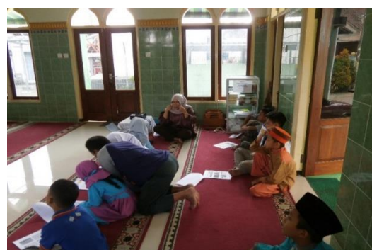
Gambar 5. Asesmen/penilaian